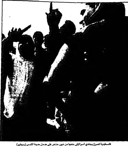
السلطة تصرح بقبول اسرائيلي معها من غير تعاون على عمل مدينة القدس (رويتز)

أعلنت رئاسة الحكومة الاسرائيلية ان اجتماع مجلس الوزراء الاسرائيلي الذي عقد في القدس امس الاول تمهيداً لمؤتمر مدريد مع ياسر عرفات في القدس، لم يجرى بعد ما عيّن ايام التصويت على اتفاق واي بلانتينش.